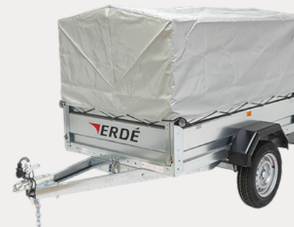
Bâche réhausse grillagée