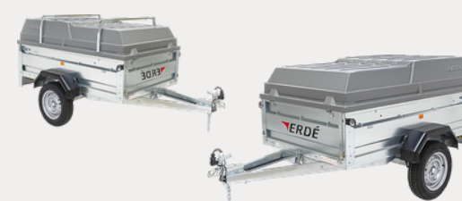
Capot ABS / Barres de capot