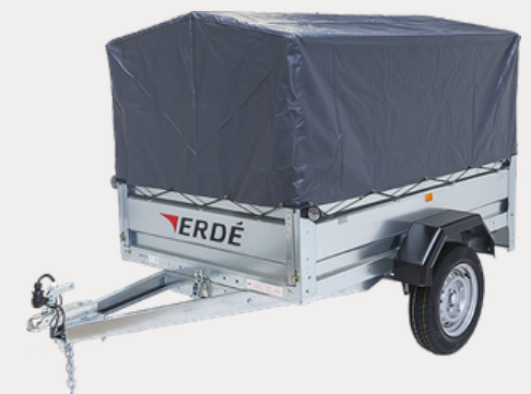
Bâche Fourgonnette (60cm)