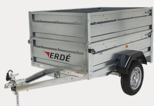
Réhausse Pleines (40cm)