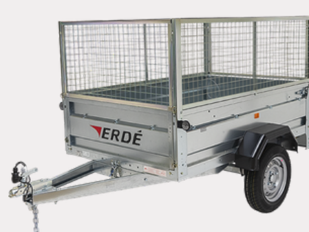
Réhausse Grillagées (60cm)