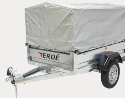
Bâche réhausse grillagée