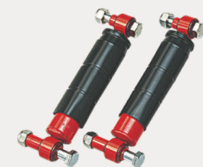
Kit amortisseurs hydrauliques

Roue de secours RS14510 Support de RS SPSY