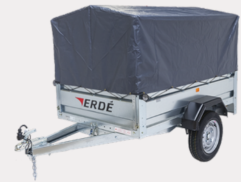
Bâche Fourgonnette (60cm)