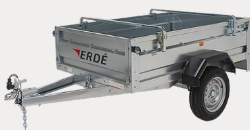
Barres porte tout universelles