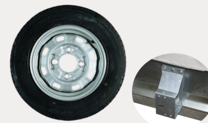
Roue de secours + Support

Roue de secours RS14510 Support de RS SPSY