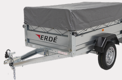
Bâche Haute (30cm)