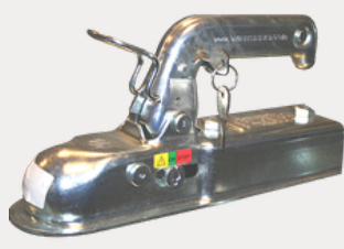
Antivol tête d'attache