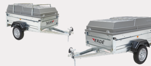
Capot ABS / Barres de capot