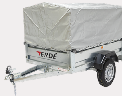
Bâche réhausse grillagée