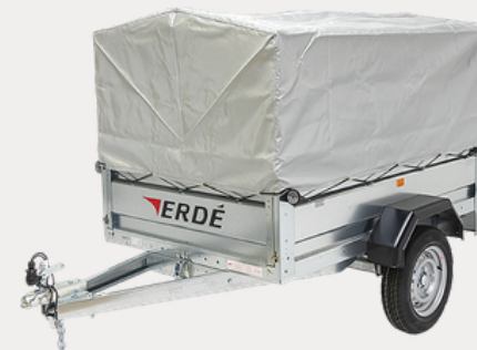
Bâche réhausse grillagée