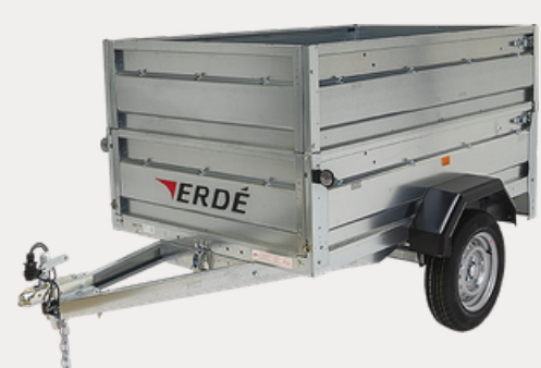
Réhausse Pleines (40cm)