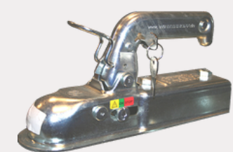
Antivol tête d'attache