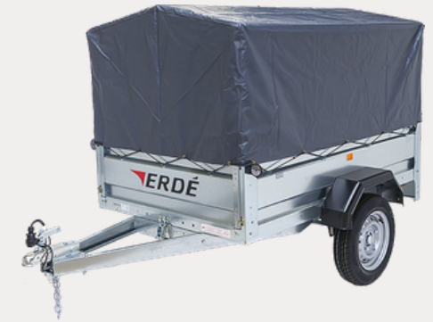
Bâche Fourgonnette (60cm)