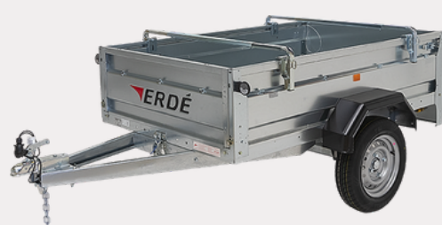
Barres porte tout universelles