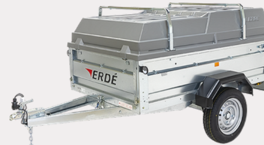
Barres de capot