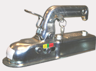
Antivol tête d'attache