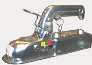
Antivol tête d'attache