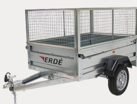
Réhausse Grillagées (60cm)