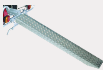
Rampe de chargement