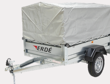
Bâche réhausse grillagée