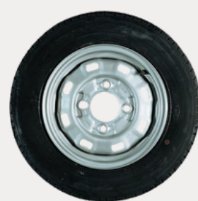
Roue de secours