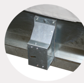
Support de roue de secours