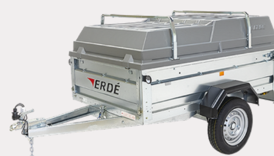
Barres de capot