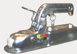
Antivol tête d'attache