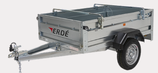
Barres porte tout universelles