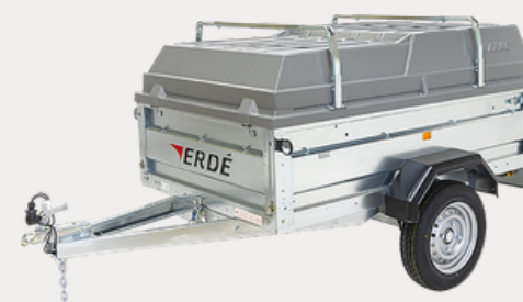
Barres de capot