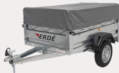
Bâche Haute (30cm)