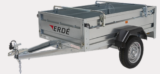
Barres porte tout universelles