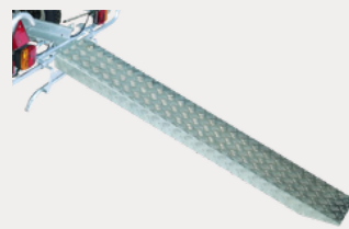
Rampe de chargement

Relevable D30 RJ125 Télescopique D48 RJ160