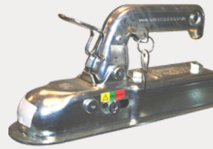
Antivol tête d'attache