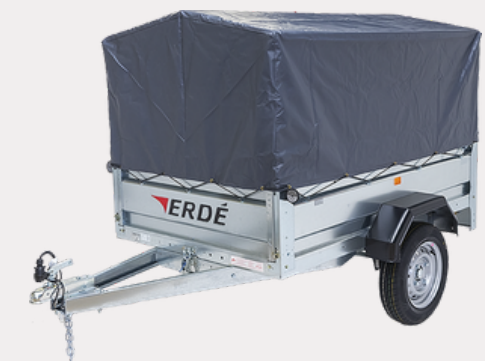
Bâche Fourgonnette (60cm)